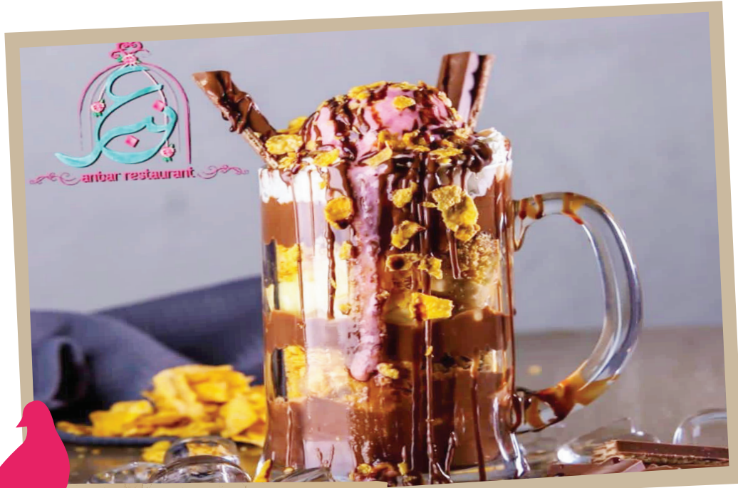
Anber Choclata Mountain