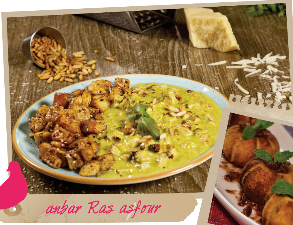
anbar Ras asfour