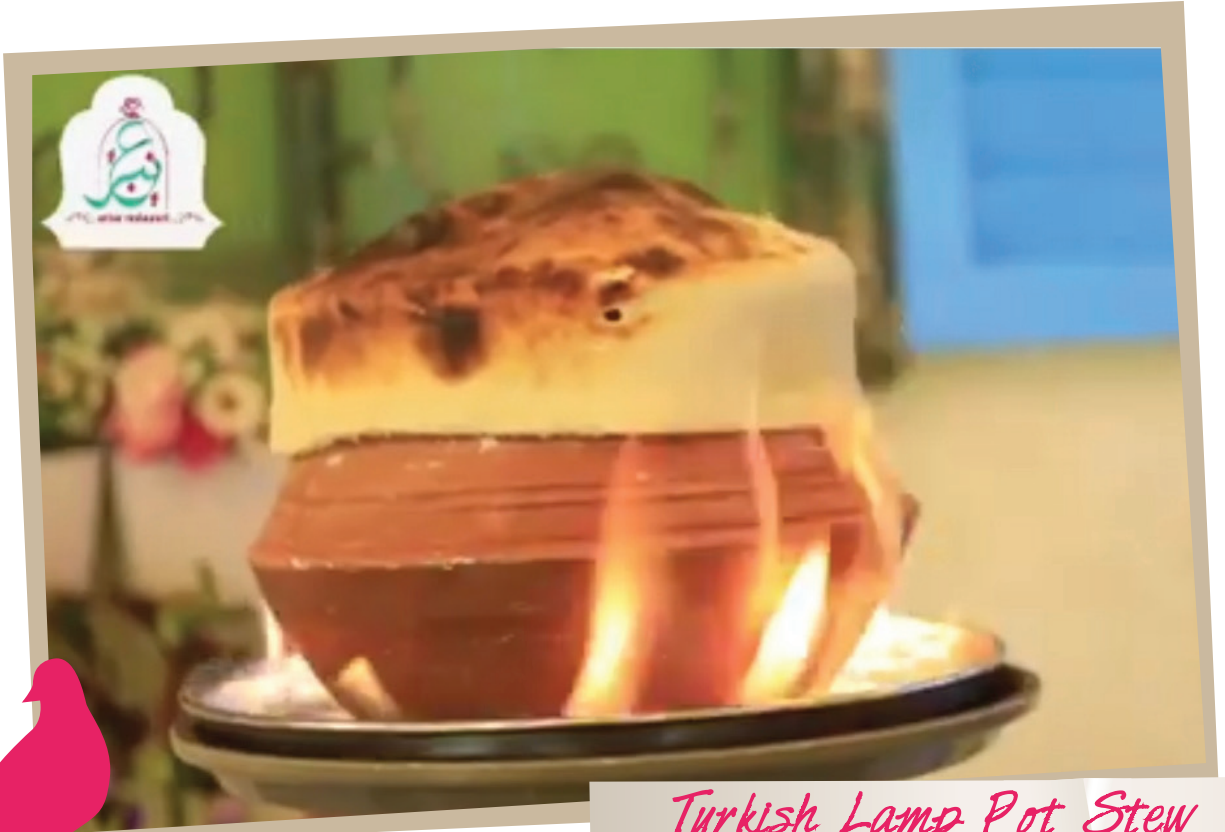
Turkish Lamp Pot Stew