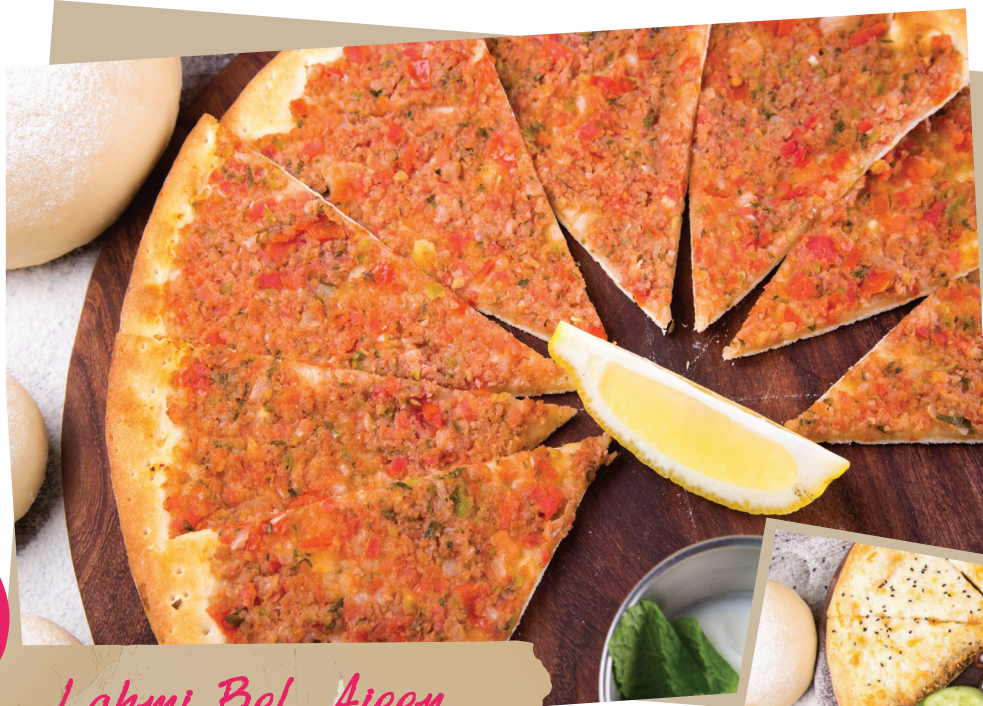
Lahmi Bel Ajeen