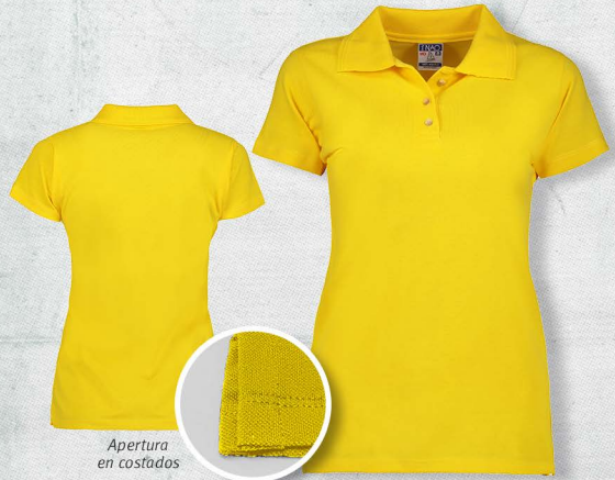
Apertura en costados