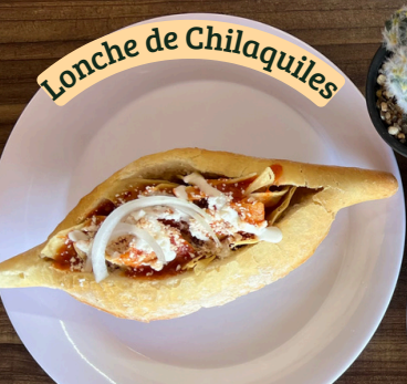
Lonche de Chilaquiles