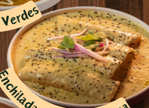
Enchiladas Crema Poblana