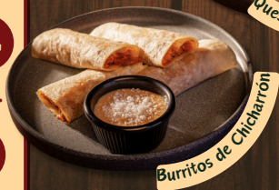
Burritos de Chicharrón