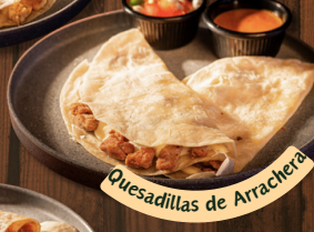
Quesadillas de Arrachera