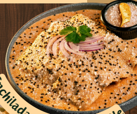
Enchiladas Crema Chipotle