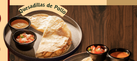
Quesadillas de Pollo