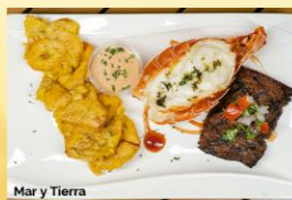
Mar y Tierra