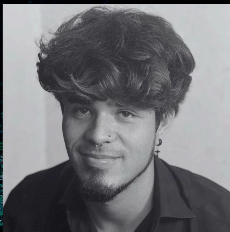
WILLIAMS HAFFETH MAQUILLAJE