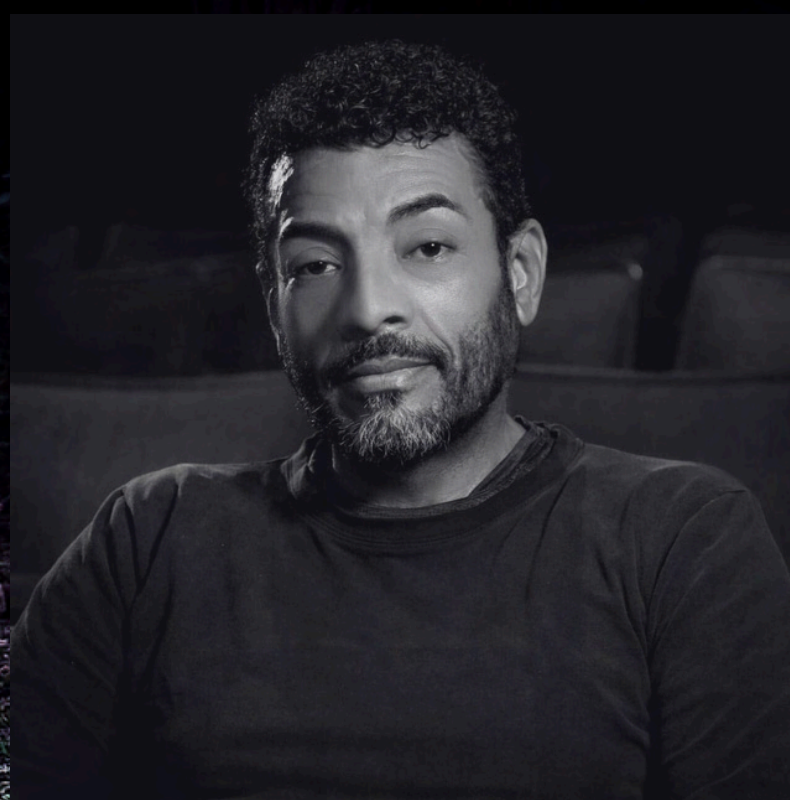
YAMIL SALOMÓN ESCENOGRAFÍA Y UTILERÍA