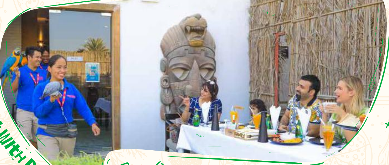
BREAKFAST WITH PARROTS