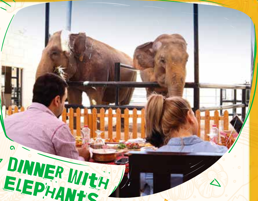
DINNER WITH ELEPHANTS