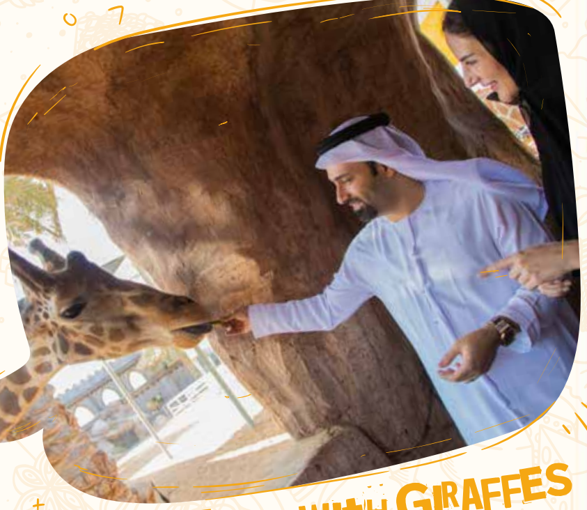
BREAKFAST WITH GIRAFFES