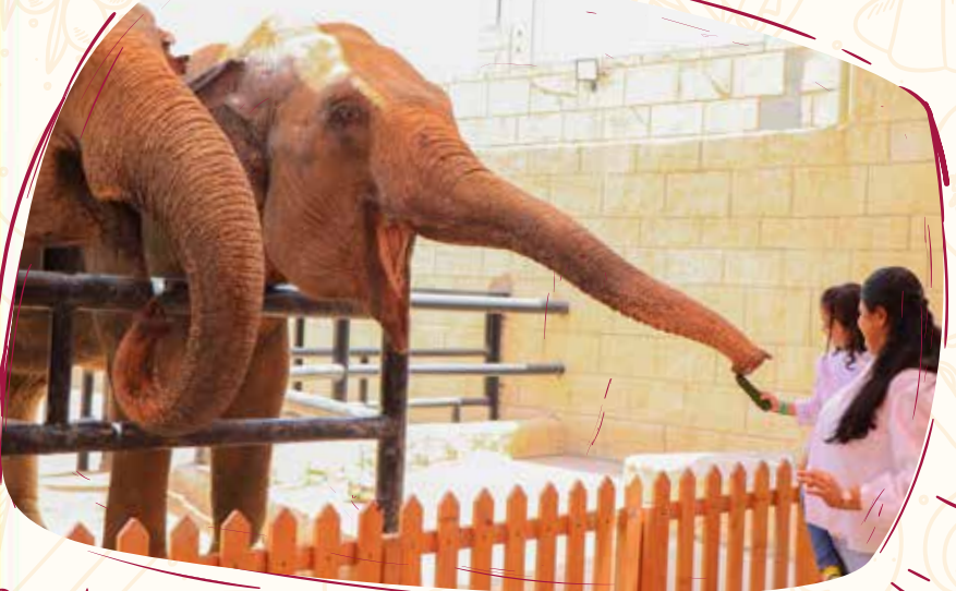
BREAKFAST WITH ELEPHANTS