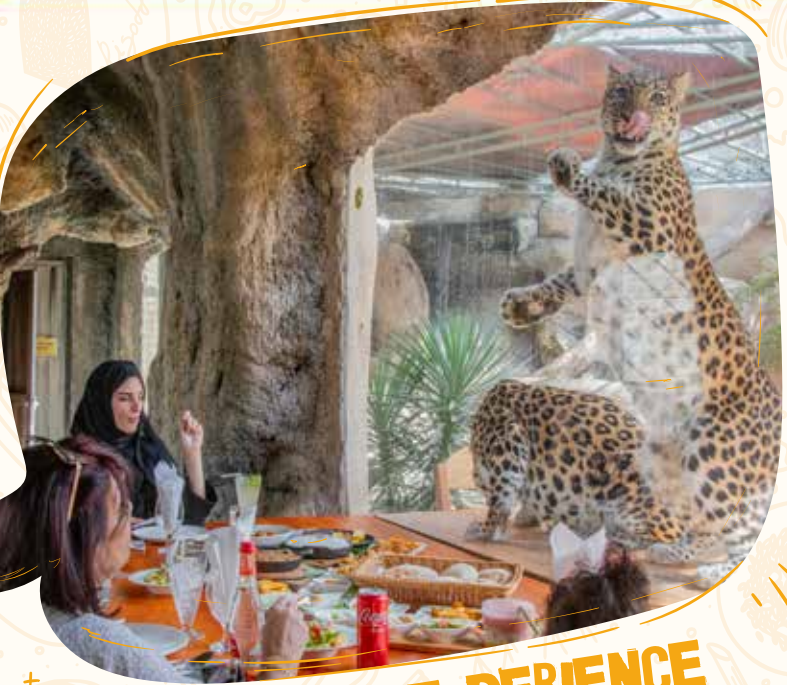
BIG CATS EXPERIENCE