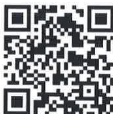
ข้อมูลองค์กรสมาชิก สภาองค์กรของผู้บริโภค