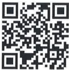
รายงานประจำปี ๒๕๖๕